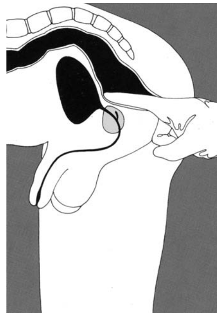
Figure 3. Le toucher rectal est utile pour déceler les maladies de la prostate.

Puisqu'elle est située devant le rectum, la prostate peut être facilement palpée lors du toucher rectal. Cet examen peut révéler une augmentation du volume, une bosse ou une zone dure sur la prostate ou encore être tout à fait normal. Dans ce dernier cas, c'est le dosage de l'antigène prostatique spécifique (APS) dans le sang qui est anormal.